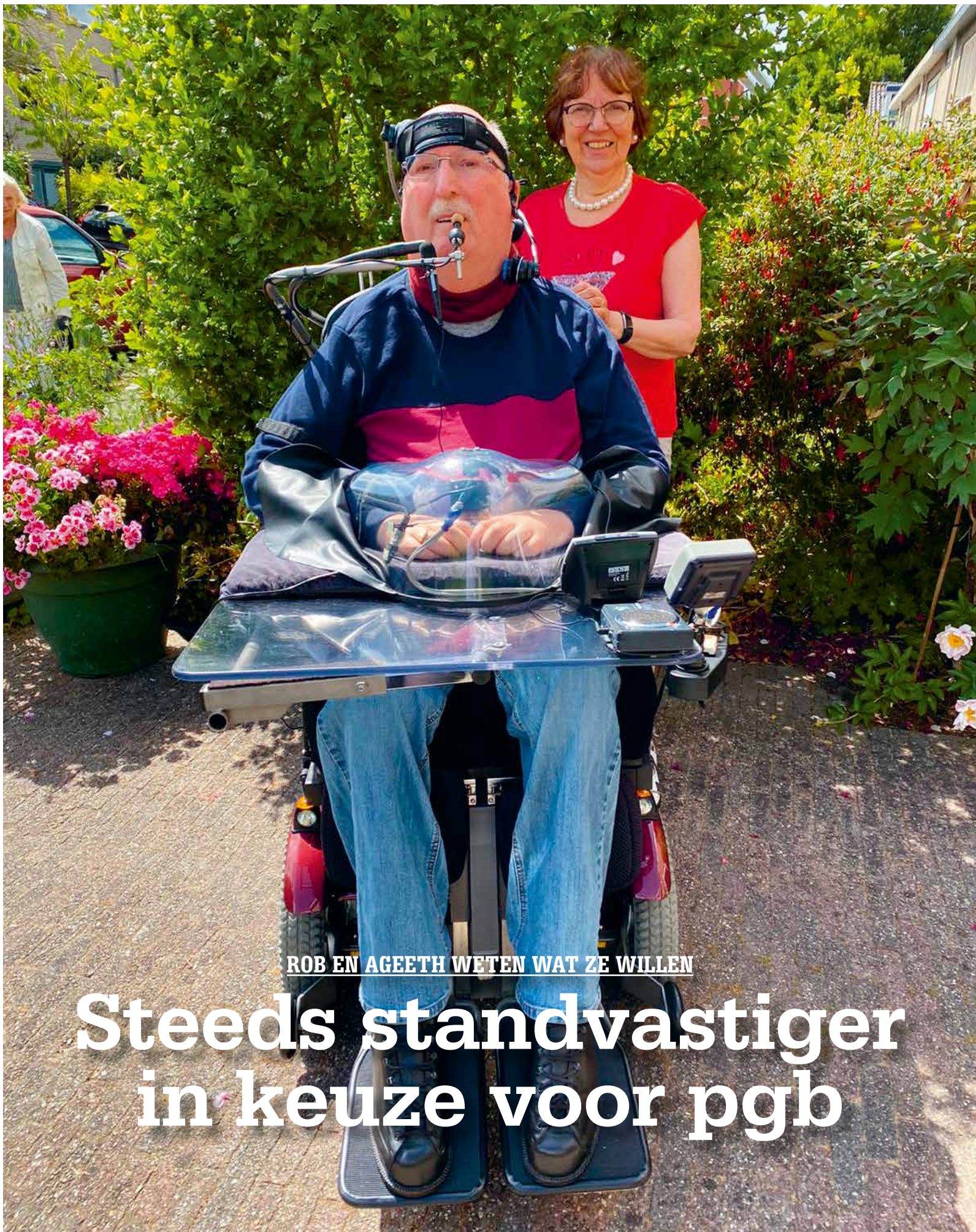
ROB EN AGEETH WETEN WAT ZE WILLEN