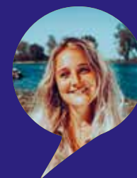
AUTEUR EVA EIKHOUT