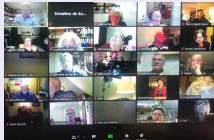
DE ONLINEBIJeenKOMST IS DOOR 100 LEDEN BEZOCHT

In het tweede deel hebben we in groepjes gepraat over 25 jaar pgb. Waar zijn we trots op? Hoe geven we met elkaar het pgb weer meer glans? Hoe maken we onze vereniging sterker? Wat zijn kansen en bedreigingen voor het pgb in de toekomst?